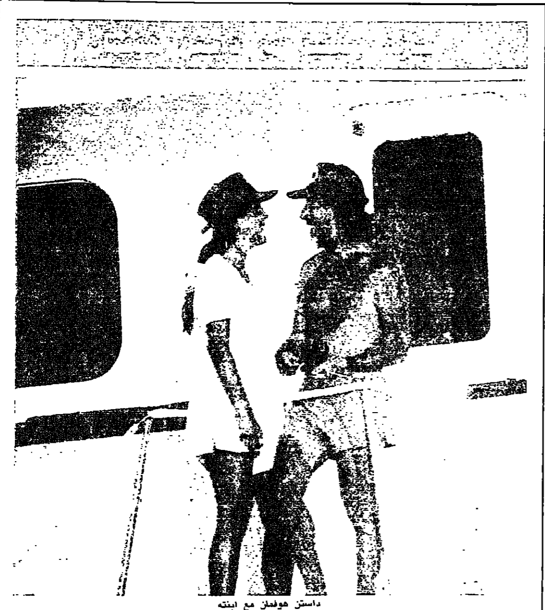
داستن هوفمان مع ابنته

اختار النجم الاميركي داستن هوفمان البث كليمينتين، ذي العلم البريطاني لتخصيه اجازته الصفيفة برفقة عائلته واحتفظ داستن خلالها بالحيوية التي اطلقها لمناسبة تصوير دوره في فيلم «تاجر البندقية» للكاتب ويليام شكسبير. اما بعد الظهيرة فهو فترة استراحة واستجمام